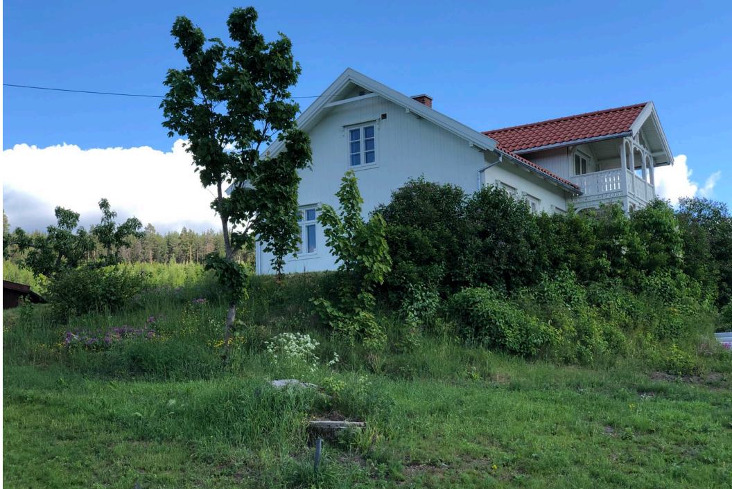
INGEBORG REFLING HAGENS KULTURHUS FREDHEIM